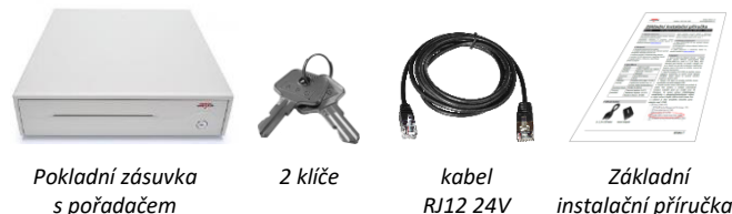
Pokladní zásuvka s pořadačem